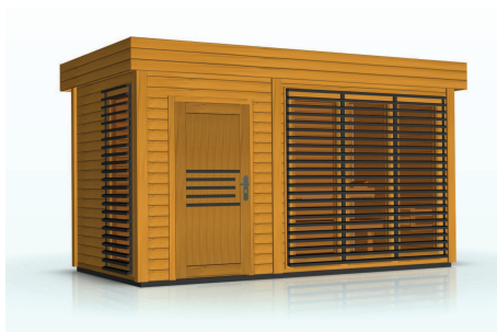
kolor: jasny dąb, antracyt