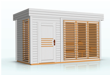
kolor: biały, jasny dąb