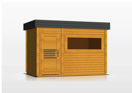
kolor: jasny dąb, antracyt