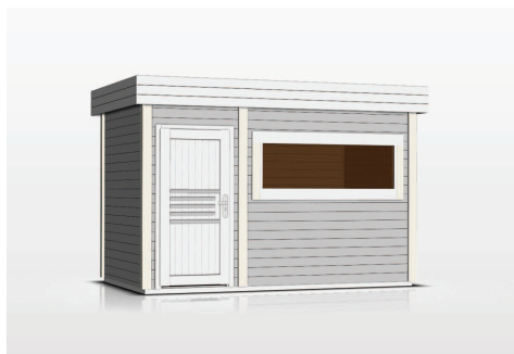
kolor: jasny szary, biały