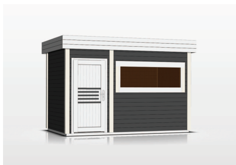
kolor: antracyt, biały