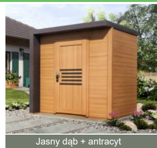
Jasny dąb + antracyt